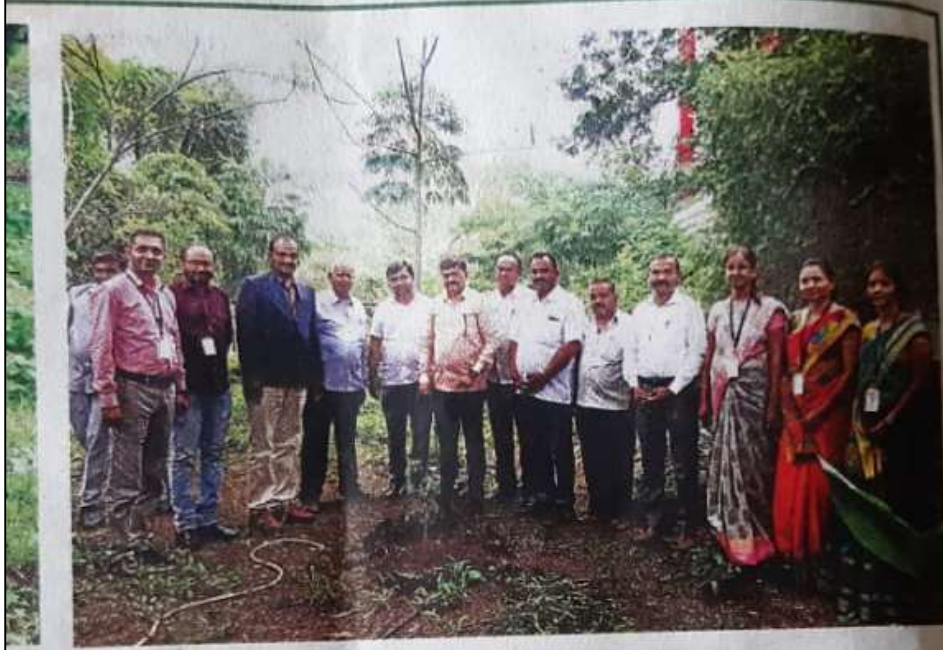
क ■ एमव्हीपी इन्स्टिट्यूट ऑफ फार्मास्युटिकल

चे दुर्भिक्ष जाणवतेय... ग्रामीण भागातील दुष्काळाचे चित्र फारच भयावह आहे... लाम! तर चला वसुंधरेला वाचविण्यासाठी एक पाऊल उचलू या.